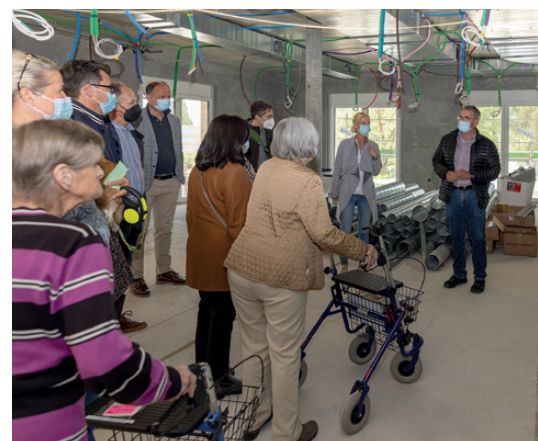
Die gestaffelt durchgeführten Führungen starteten zwischen Kabeln und Rohren in der künftigen Cafeteria.