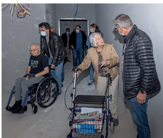
Die 61 neuen Zimmer waren besonders interessant für die Besucherinnen und Besucher. Die Wände waren zwar noch etwas grau. Mit etwas Fantasie liess sich jedoch bereits erahnen, wo künftig das Bett und der Tisch stehen werden.