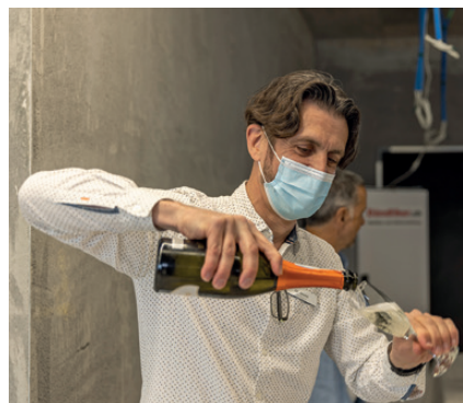
Beim Apéro verwöhnte das Breiten-Team die Anwesenden, sodass diese die Eindrücke bestens verarbeiten konnten.