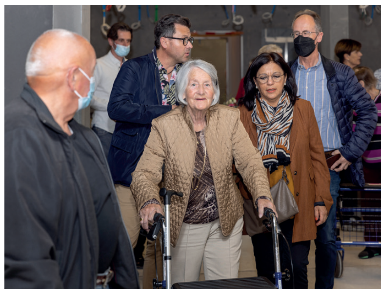
Rund 65 Personen haben sich für den Inforundgang interessiert.