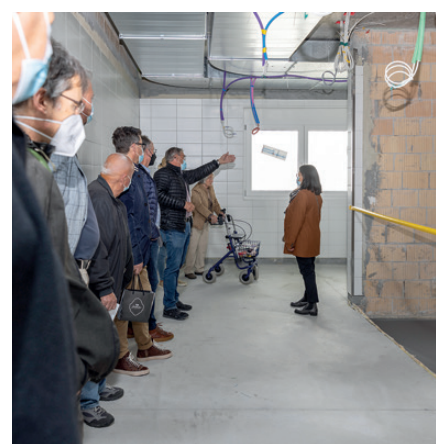
In der Küche wird künftig wieder mit viel Herzblut für das Wohl aller Bewohnerinnen und Bewohner gesorgt.