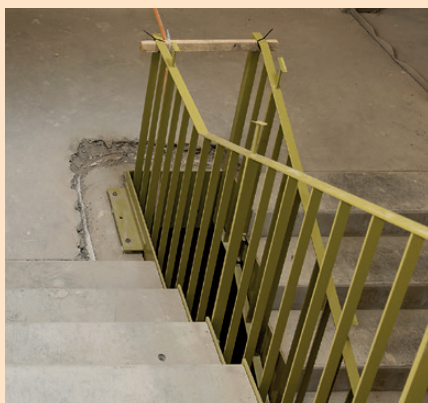
Das bereits montierte grüne Treppengeländer lässt das Farbkonzept erahnen.

Ein Blick in die Entstehung des Farbkonzeptes: Das neue Alterszentrum Breitlen wird mit Naturtönen und Naturmaterialien arbeiten. Als Inspirationsquelle gilt unsere Adresse, die Obstgartenstrasse. So werden künftig Wände und einzelne Elemente in den Farben von Früchten für Farbakzente sorgen: Das saftige Grün von Birnen, das leuchtende Orange von Aprikosen oder auch das gedämpfte Gelb von Quitten helfen, sich im neuen Alterszentrum zurechtzufinden und wohlfühlen.