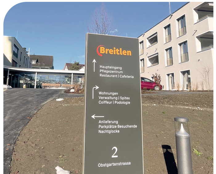
Alles unter einem Dach – das neue Alterszentrum Breitlen